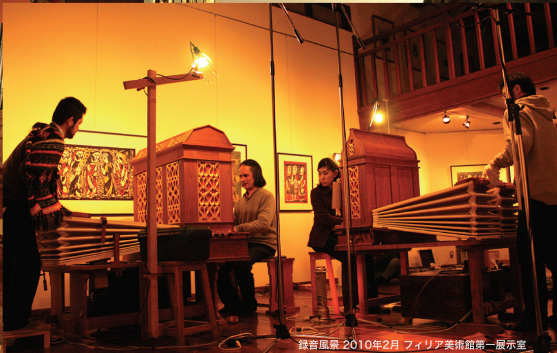
録音風景 2010年2月 フィリア美術館第一展示室